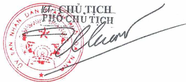
Trần Chí Cường